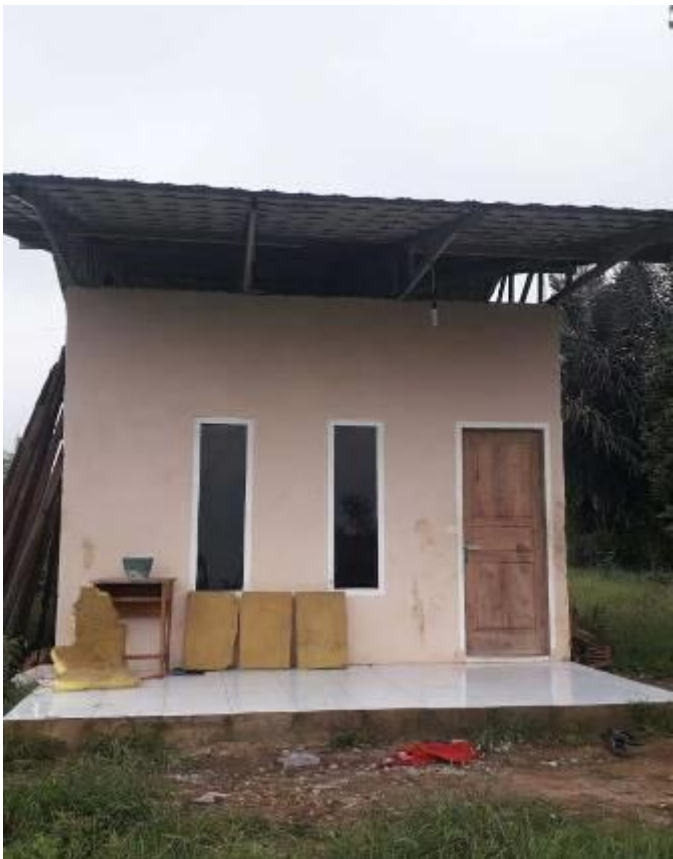
Klasgebouw 2 - resultaat