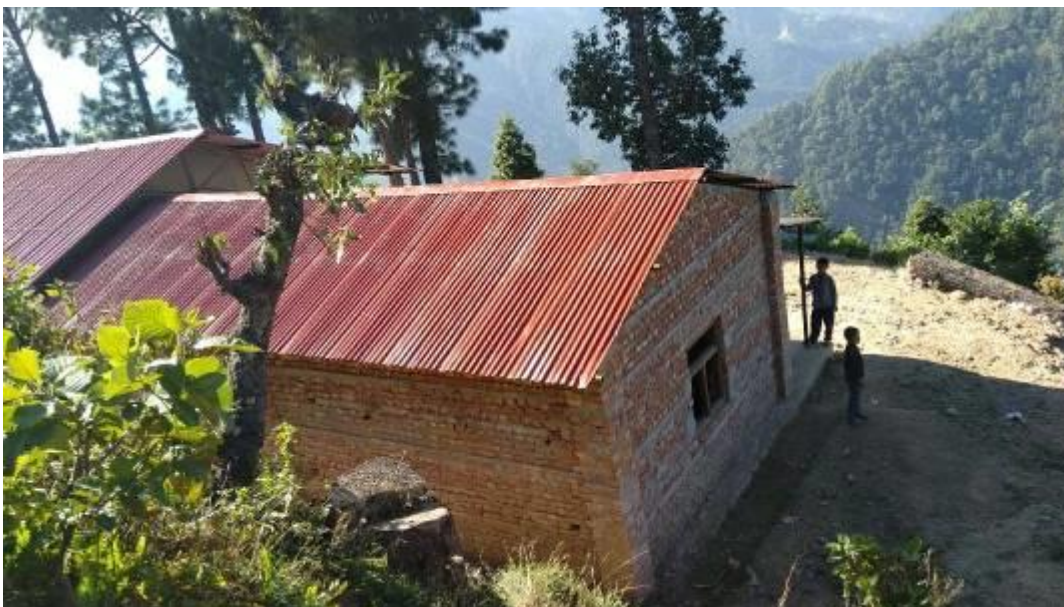
Twee extra klasjes