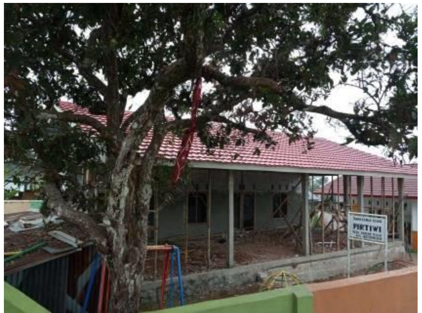
Het voorlopige resultaat